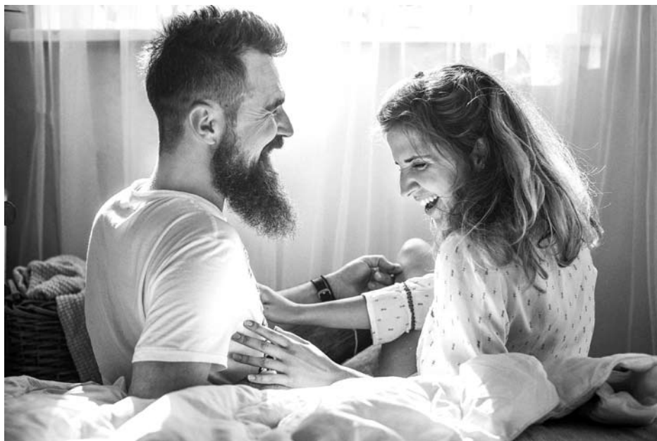
Už šią fotografiją Ieva Vogulienė buvo apdovanota pasauliniame fotografijos konkurse.