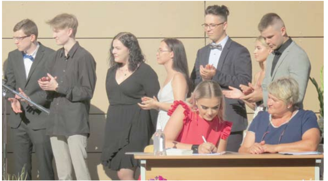
Gavę brandos atestatą, absolventai turėjo pasirašyti dokumentų išdavimo knygoje.

Prieš metus baigęs šią gimnaziją, Š. Grigonis kvietė abiturientus džiaugtis ir švęsti. „Prabėgus metams po mokyklos baigimo,