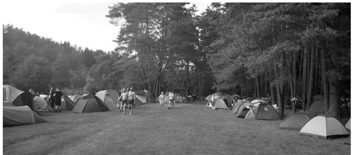
Festivalio dalyviai įsikūrė palapinių miestelyje.