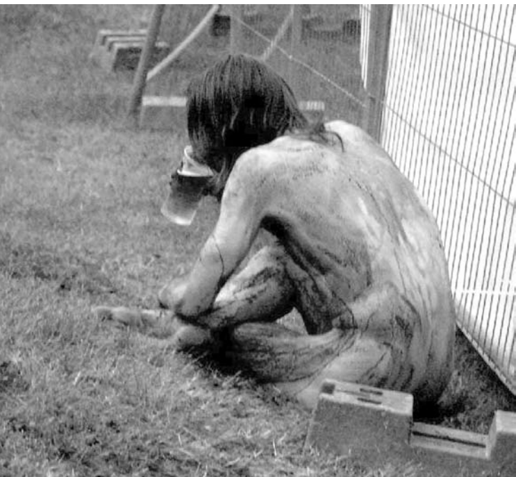
„Devilstone“ festivaliuose netrūko šokiruojamų vaizdų.

Jau keletą metų iš eilės „Devilstone“ festivalis vyksta be jokių skandalų. Net policijos pareigūnai stebisi, kad kasmet festivalio metu pavyksta išvengti rimtesnių incidentų.