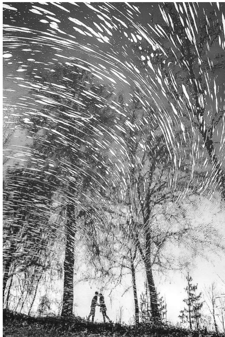
Nesuvaidintos emocijos – svarbus geros fotografijos akcentas.

„Ne nuo technikos priklauso, kokia bus nuotrauka. Svarbu fotografo igūdžiai, stiliстика, tai, kaip jis moka atpalaiduoti žmones, kad jie nuotraukose atrodytų ne dirbtinai, o natūraliai. Viskas turi būti gražu ir vientisa, ir tai yra labai didelio dar-