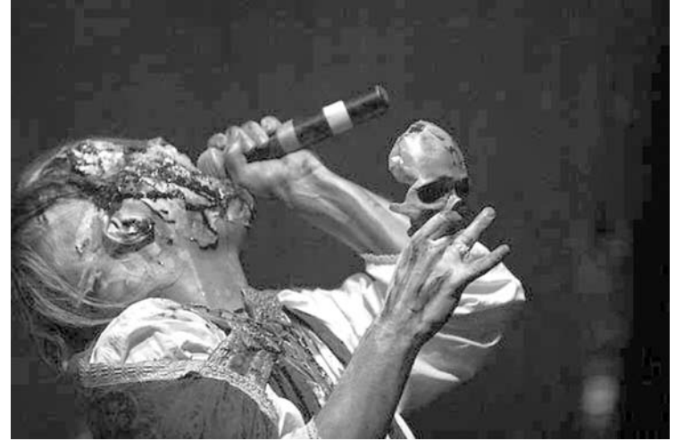
2010-aisiais „Devilstone“ koncertavusi norvegų grupė „Mayhem“ sukėlė religinės bendruomenės pasipiktinimą.

Minifestivaliui-stovyklai „Popskull“ Anykščių rajono savivaldybė skyrė kuklią 1 tūkst.600