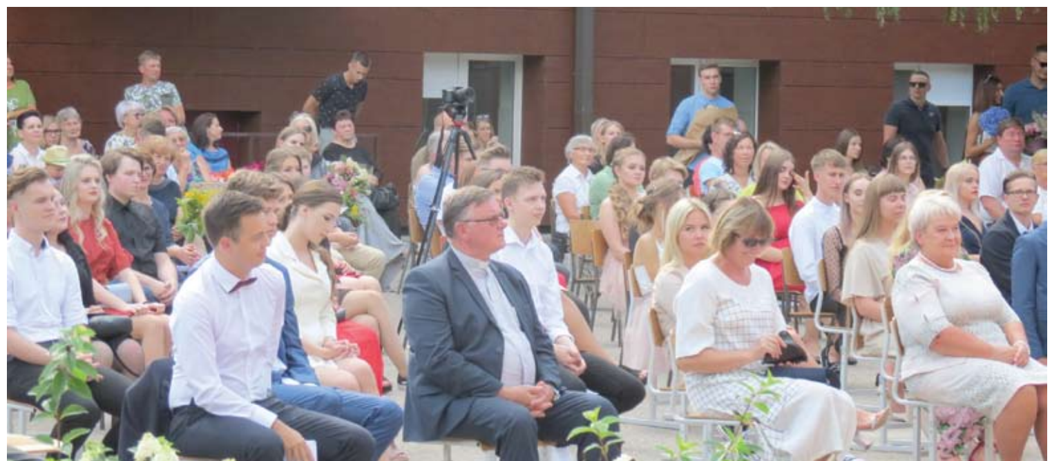
Šiūmetis abiturientų išleistuvių renginys vyko laikantis prevencijos reikalavimų - išlaikant atstumus atviroje lauko erdvėje.