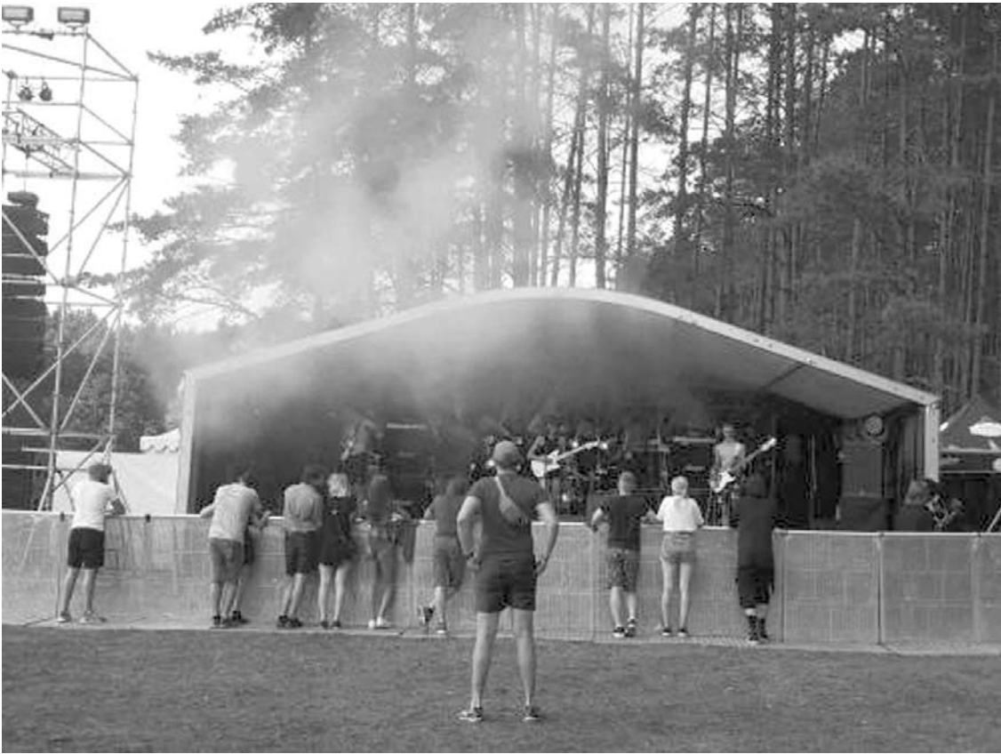
Minifestivaliui-stovyklai „Popskull“ Anykščių rajono savivaldybė skyrė 1 tūkst.600 Eur paramą.